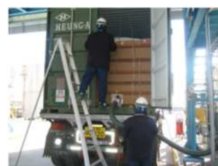
③フレキシブルタンク/19.5MT