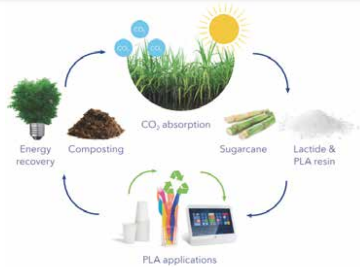
Fig 1. Luminy® PLA portfolio from Total Corbion PLA