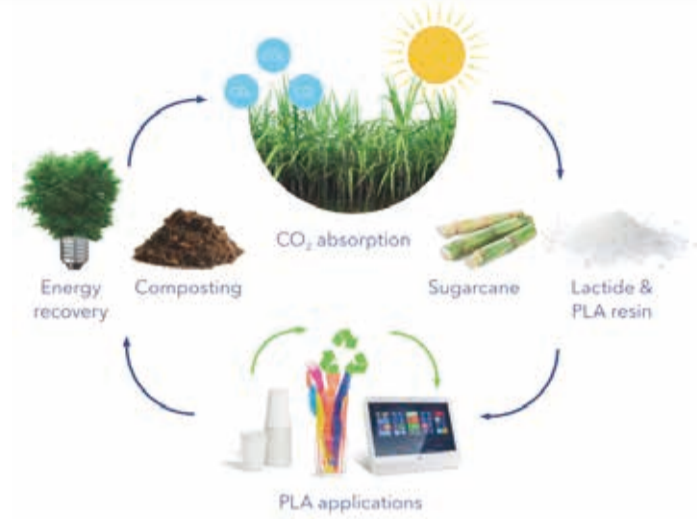
Fig 1. Luminy® PLA portfolio from TotalEnergies Corbion bv