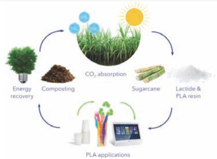
Fig 1. Luminy® PLA portfolio from Total Corbion PLA